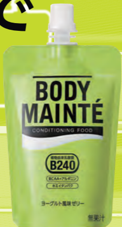
ボディメンテ ゼリー

※「バリアする」とは、コンディショニングに欠かせない成分が、いつもと変わらない体調と自分らしさを守ることです。