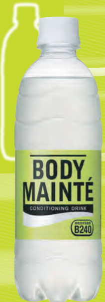
ボディメンテ ドリンク